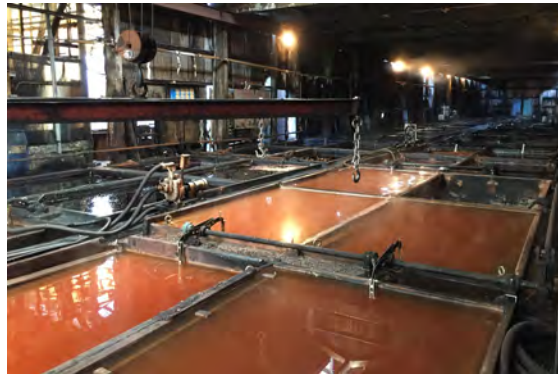
タンニン材の入ったピット槽