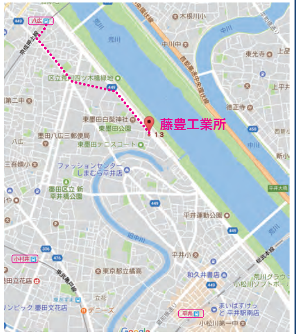
MAP 京成電鉄押上線 八広駅より徒歩約17分