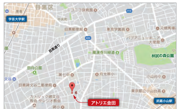
会場 アトリエ金田